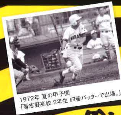
1972年 夏の甲子園 「習志野高校 2年生 四番バッターで出場。」